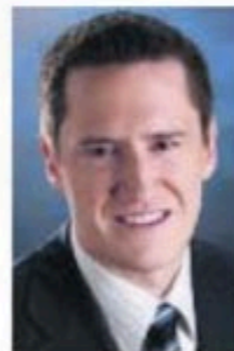
BENOIT CHARETTE Député de Deux-Montagnes

Adresse de circonscription 15, chemin de la Grande-Côte, bureau 105 Saint-Eustache (Québec) J7P 5L3 Tél: 450-623-4963 Téléc: 450-623-7178 Courriel: bcharette@assnat.qc.ca www.benoitcharette.org