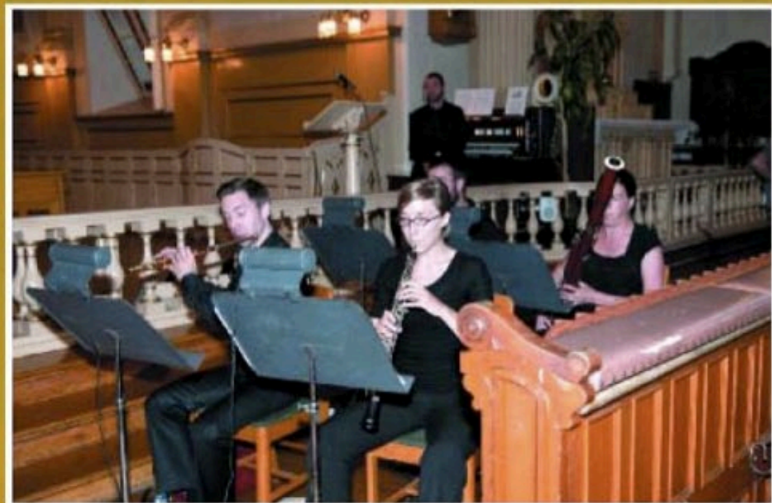
Quelques musiciens de l'orchestre du Festival Opéra installés dans l'église de Saint-Eustache lors du spectacle Opéra en France .