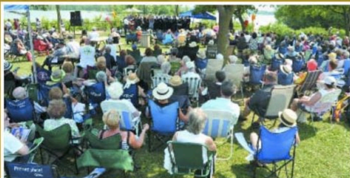
Plusieurs personnes se sont rassemblées sur la Promenade Paul-Sauvé pour venir écouter gratuitement le concert viennois qui y était présenté comme spectacle de fermeture du Festival.

Conseil Arts et Culture de Saint-Eustache