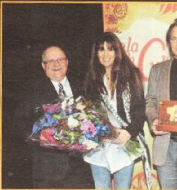
L'École de théâtre du Vieux Saint-Eustache, dirigée par Stefano Corbo, a fait l'objet de l'hommage spécial illustré par la diffusion ou la promotion d'œuvres liées à la vie culturelle eustachoise.

Texte: Jean-François Carignan