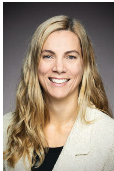
L'honorable Pascale st-Onge

À titre de ministre du Patrimoine canadien, je remercie toutes les personnes qui ont orchestré la tenue de cette grande fête de l'art lyrique. Merci de faire rayonner nos artistes et de valoriser la relève. Je vous souhaite bon succès ainsi que mes meilleurs vœux en ce 15 e anniversaire!