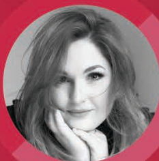
JUSTINE LEDOUX MEZZO