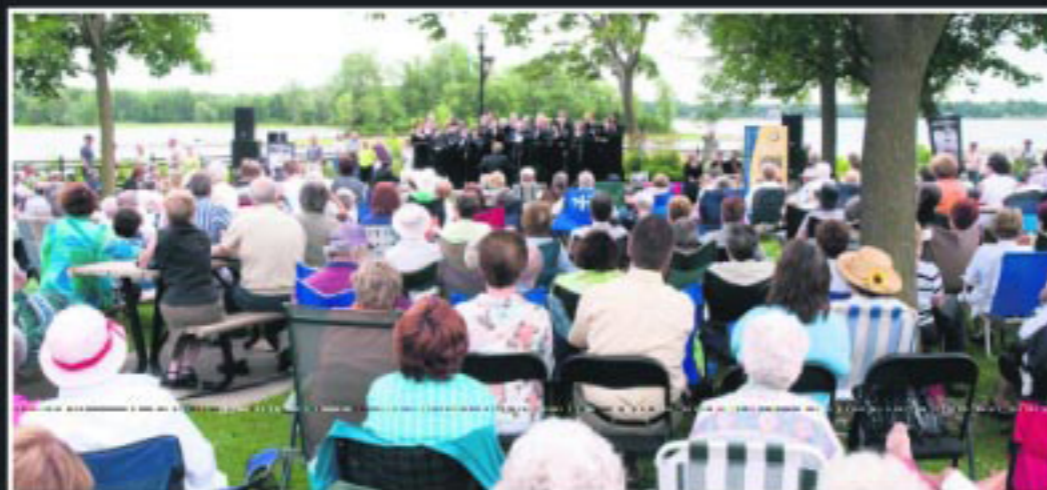
Les Dimanches sur la promenade ont laissé place au gala des opéras italiens, avec un concert offert au public gratuitement. Dans un décor aussi enchanteur que celui de la promenade Paul-Sauvé, les cœurs des 2 000 spectateurs présents ont été conquis!