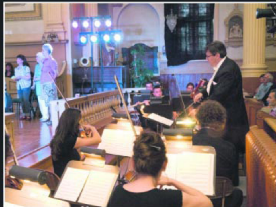
C'est sous la direction musicale du chef d'orchestre français Vincent Monteil que la soirée Offenbach s'est déroulée, avec l'orchestre du Festival Opéra.